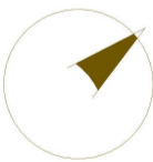
Orientación del plano comercial Escala del plano 1:60